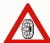
4 Pneuri antiderapante Шины с элементами противоскользяния