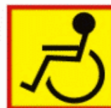
8 Conducător invalid Инвалид