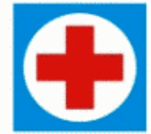
9 Conducător medic Водитель-врач