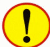
15 Conducător începător Начинающий водитель