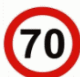
11 Limitare de viteză Ограничение скорости