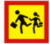
5 Copii Дети