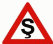
10 Școală Учебное транспортное средство