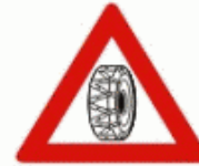
4 Pneuri antiderapante Шины с элементами противоскольжения