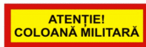
16 Coloană militară Воинская колонна