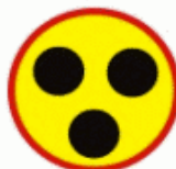
7 Conducător surdomut Глухонемой водитель