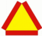
6 Vehicul lent Тихоходное транспортное средство