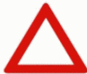
14 Triunghi de presemnalizare Знак аварийной остановки