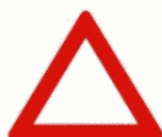
14 Triunghi de presemnalizare Знак аварийной остановки