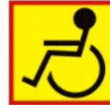
8 Conducător invalid Инвалид