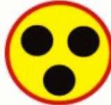
7 Conducător surdomut Глухонемой водитель