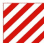
12 Încărcătură cu gabarit depășit Крупногабаритный груз