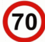
11 Limitare de viteză Ограничение скорости