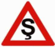
10 Școală Учебное транспортное средство