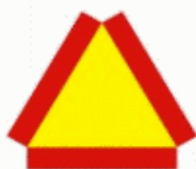
6 Vehicul lent Тихоходное транспортное средство