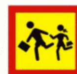
5 Copii Дети