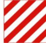
12 Încărcătură cu gabarit depășit Крупногабаритный груз