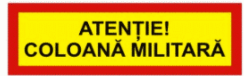
16 Coloană militară Воинская колонна