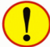
15 Conducător începător Начинающий водитель