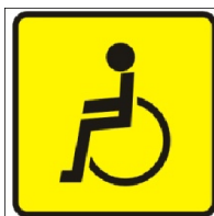
„შეზღუდული შესაძლებლობის მქონე პირი“