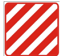
„არაგაბარიტული (მსხვილგაბარიტის) ტვირთი“